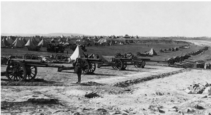
'n Voorbeeld van die oorlog.