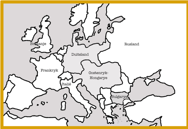
1914 tot 1918 n.C Die Eerste Wêreldoorlog