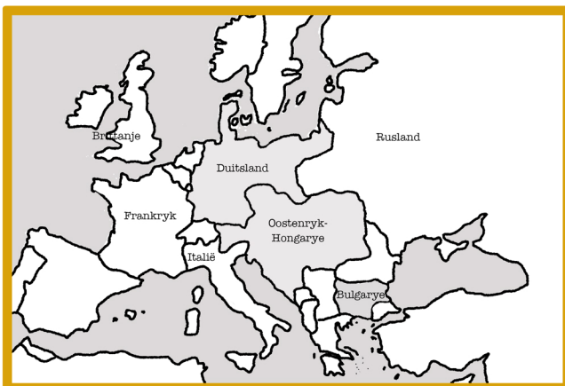
1914 tot 1918 n.C Die Eerste Wêreldoorlog