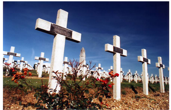
'n Begraafplaas vir 130 000 soldate wat dood is in Frankryk.